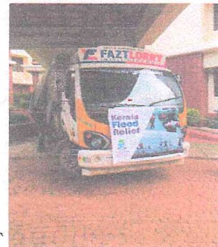
Transportation of relief supplies