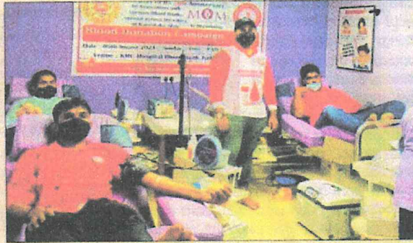
ಐದು ವರ್ಷಗಳ ಒಂದೆ ಸ್ವಾಸ್ಥನೆಗೊಂಡು ರಕ್ತದಾನದಲ್ಲಿ ತೊಡಗಿಸಿಕೊಂಡಿರುವ ಸಂಘಟನೆಯು ಇದೀಗ ಏಕಕಾಲದಲ್ಲಿ 21 ರಕ್ತದಾನ ಶಿಬಿರಗಳನ್ನು ಮಾಡಿ, 603 ಯುನಿಟ್ ರಕ್ತ ಸಂಗ್ರಹ ಮಾಡಿದೆ. ಇದರ ಯಶಸ್ಸಿನಲ್ಲಿ ಹಲವು ಸಂಘಟನೆಗಳು, ಆಸ್ಪತ್ರೆಗಳ ರಕ್ತನಿಧಿಗಳು, ರಕ್ತದಾನಿಗಳ ಸಹಯೋಗವಿದೆ. ಹಲವು ಬೀವಗಳನ್ನು ಉಳಿಸಲು ನೆರವಾದ ಸಂತ್ಸುಪ್ತಿ ನಮನು.

ಎಲ್ಲೆಲ್ಲಿ ಶಿಬಿರ: ಬೆಂಗಳೂರಿನಲ್ಲಿ ಹೆಣ್ಣುರು ಕ್ರಾಸ್ ಮತ್ತು ಜಿ.ಪಿ.ನಗರದ ಲಯನ್ಸ್ ರಕ್ತ ನಿಧಿಯೊಂದಿಗೆ- 55 ಯುನಿಟ್, ಮೈಸೂರು ಲಯನ್ಸ್ ಜೀವಾಧಾರ ರಕ್ತ ನಿಧಿಯಲ್ಲಿ- 20, ಮಡಿಕೇರಿ ಜಿಲ್ಲಾಸ್ಪತ್ರ ರಕ್ತ ನಿಧಿಯಲ್ಲಿ ಕೊಡಗು ಬೃಹತ್ ಡೋನರ್ಸ್ ಸಹಕಾರದೊಂದಿಗೆ- 11, ಹಾಸನ ರಕ್ತನಿಧಿಯಲ್ಲಿ- 24, ಪುತ್ತೂರು ರೋಟರಿ ಕ್ಲಬ್ಬೊ ಬೃಹತ್ ಬ್ಯಾಂಕ್- 50, ಮೂಡುಬಿದರಿ ಆಳಾಸ್ ಆಸ್ಪತ್ರೆ ರಕ್ತನಿಧಿಯಲ್ಲಿ ಬೃಹತ್ ಡೋನರ್ಸ್ ಹೆಲ್ಪ್ ಲೈನ್ ಸಹಕಾರದೊಂದಿಗೆ- 15, ಮಂಗಳೂರು ಕೆ.ಎಂ. ಆಸ್ಪತ್ರೆ ರಕ್ತನಿಧಿಯಲ್ಲಿ ಟೀಂ ಯುನಿಟ್ ಉಡುಪಿ