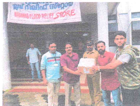
Handing over supplies to the Wayanad flood relief cell authorities

The District Collector, Wayanad and the authorities at the Wayanad flood relief cell received the timely contributions made by the University and were in great appreciation towards the support and help given.