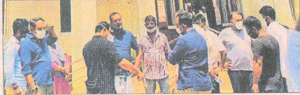
ಉಳ್ಳಾಲ ಸಮುದಾಯ ಆರೋಗ್ಯ ಕೇಂದ್ರಕ್ಕೆ ಶಾಸಕ ಖಾದರ್ ಅವರು ಭೇಟಿ ನೀಡಿದರು.

ವೈದ್ಯರ ಸೇವೆ ಹಾಗೂ ಆಸ್ಪತ್ರೆಯ ಸಂಪೂರ್ಣ ನಿರ್ವಹಣೆಯನ್ನು ಯೇನಪೋಯ ಸಂಸ್ಥೆ ವಹಿಸಿಕೊಂಡಿದೆ. 20 ನರ್ಸ್‌ಗಳು, 12 ವೈದ್ಯರು, ಅಟೆಂಡರ್, ಕ್ಲೀನರ್, ಡೇಟಾ ಎಂಟ್ರಿ ಆಪರೇಟರ್,