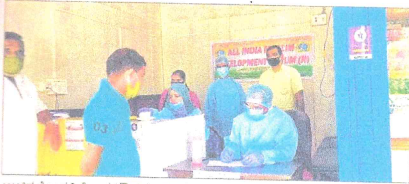
ಉಚಿತ ರೋಗ ನಿರೋಧಕ ಔಷಧ ವಿತರಣೆ ನಡೆಯಿತು.