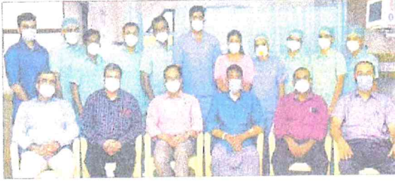
ಗುಣಮುಖನಾದ ವ್ಯಕ್ತಿಯೊಂದಿಗೆ ಹೃದ್ಯೋಗ ಚಿಕಿತ್ಸಕ ತಂಡ.

ಮಂಗಳೂರು ಸಮೀಪದ 55ರ ಪರೆಯದ ರೈತರೊಬ್ಬರಿಗೆ ಒಬ್ಬ ದುತ್ತು ಬೆನ್ನು ನೋವು ಕಾಣಿಸಿಕೊಂಡ ಕಾರಣ ಹೈದ್ರರನ್ನು ಸಂಪರ್ಕಿಸಿದರು. ಸ್ವಲ್ಪ ಸ್ವಲ್ಪನಲ್ಲಿ ಆಯಾರ್ಟಿಕ್ ಡಿಸೆಕ್ಷನ್